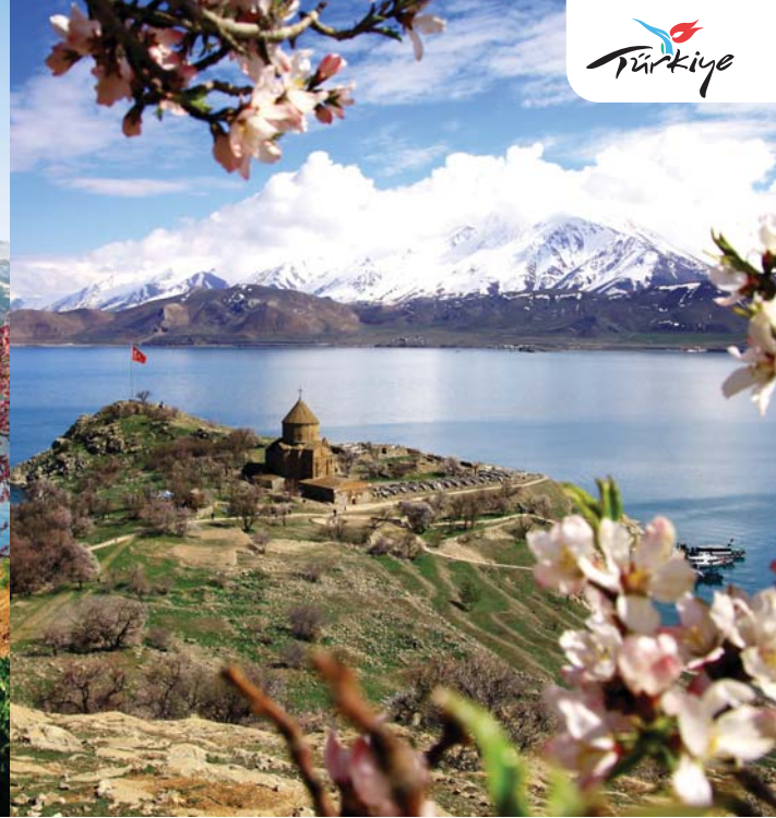
Akdamar'a bahar badem ağaçlarıyla gelir...